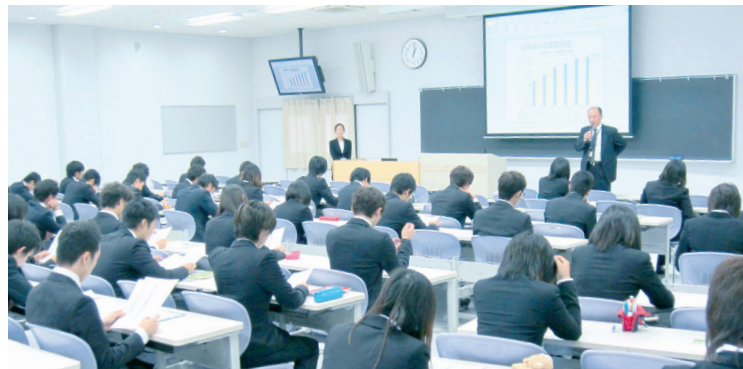
就職内定・進路合格者数一覧 (2013年2月28日現在、数字は人数)

長引く日本経済の低迷で7期生の就職は、厳しさが予想されたが、2月末の就職内定者は前年よりも大幅増で順調に進路が決まっています。 260人の就職希望者のうち、内定者は191人で内定率は73.5%で、前年同期の58.6%を大きく上 回った。関西アーバン銀行や大和ハウス工業など一般企業(上場)に54人が決まったほか、スポーツ系企業では大手のミスノやエスエスケイ、イトマンスイミングスクールなど本学の学びの特色を活かせる企業に63人、県内の企業には20人の就職が決まっている。 また、消防、警察関係の公務員が既卒を含めて33人、関心の高い教員は採用試験の合格者が現役と大学院生が各1人、卒業生が近年では最多の35人で昨年の合格者21人を大きく上回る好結果になった。