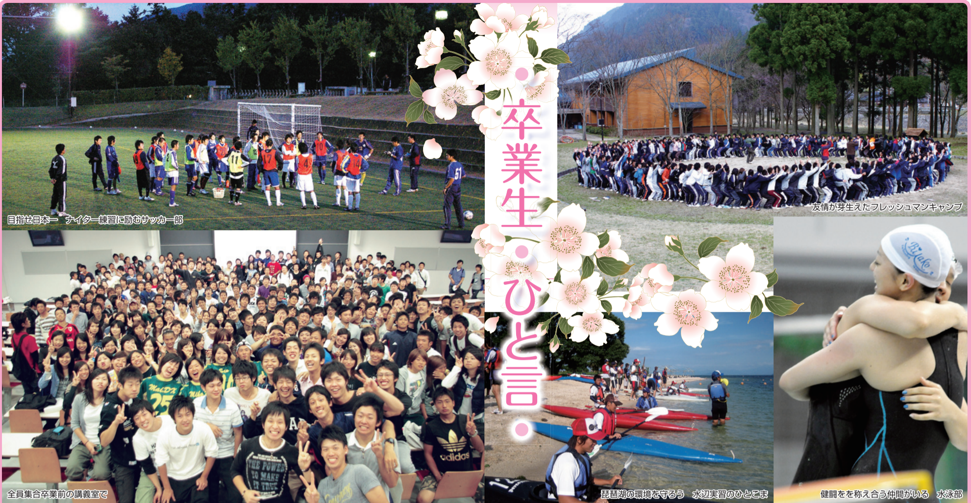
目指せ日本一 ナイター練習に励むサッカー部