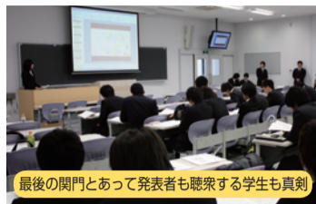
最後の関門とあって発表者も聴衆する学生も真剣

4年間の学びの集大成になる5期生の卒業論文発表会が1月下旬から2月上旬にかけて各コースに分かれて行われた。卒業への最後の関門とあって、壇上に立つ学生は真剣そのもので、時間をかけて調べた研究成果を発表した。