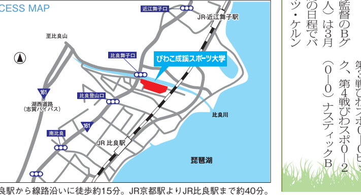
JR比良駅から線路沿いに徒歩約15分。JR京都駅よりJR比良駅まで約40分。

〒520-0503 大津市北比良1204番地 【代表】TEL:077-596-8410 FAX:077-596-8419 E-mail:jim@bss.ac.jp