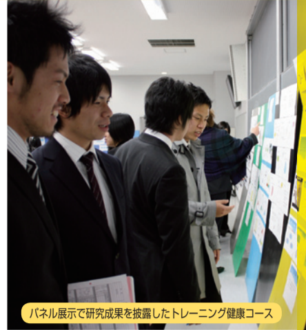
パネル展示で研究成果を披露したトレーニング健康コース