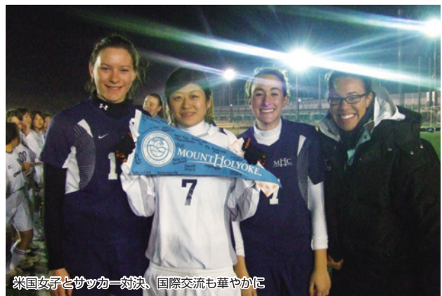
薬国女子とサッカー一対決、国際交流も華やかに