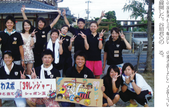
びわスポ「39レンジャー」