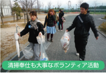
清掃奉仕も大事なボランティア活動

2年目を迎えた「39レンジャー」 「遠足のお手伝いをお願いできますか」「夏祭りの企画を立ててください」。昨春、びわスポ大に誕生したボランティアサークル「39(サンキユー)レンジャー」の活動が湖西地区の小、中学校や自治会から人気を集めている。