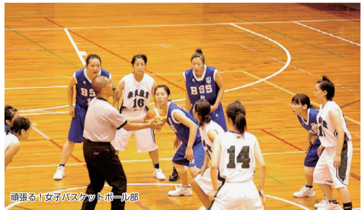
頑張る!女子バスケットボール部