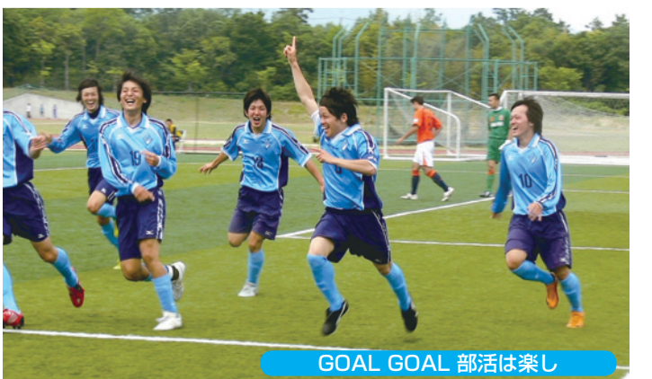
GOAL GOAL 部活は楽し