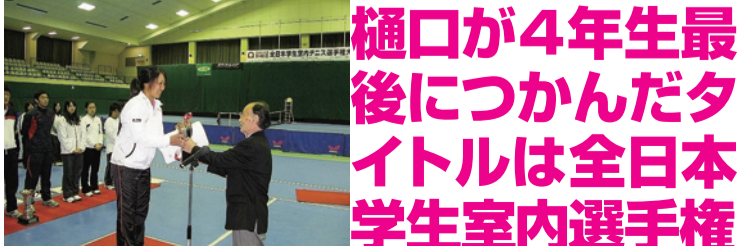
昨年夏の関西学生トーナメントでシングルス、ダブルスの2冠を制して堂々のチャンピオンスピーチ