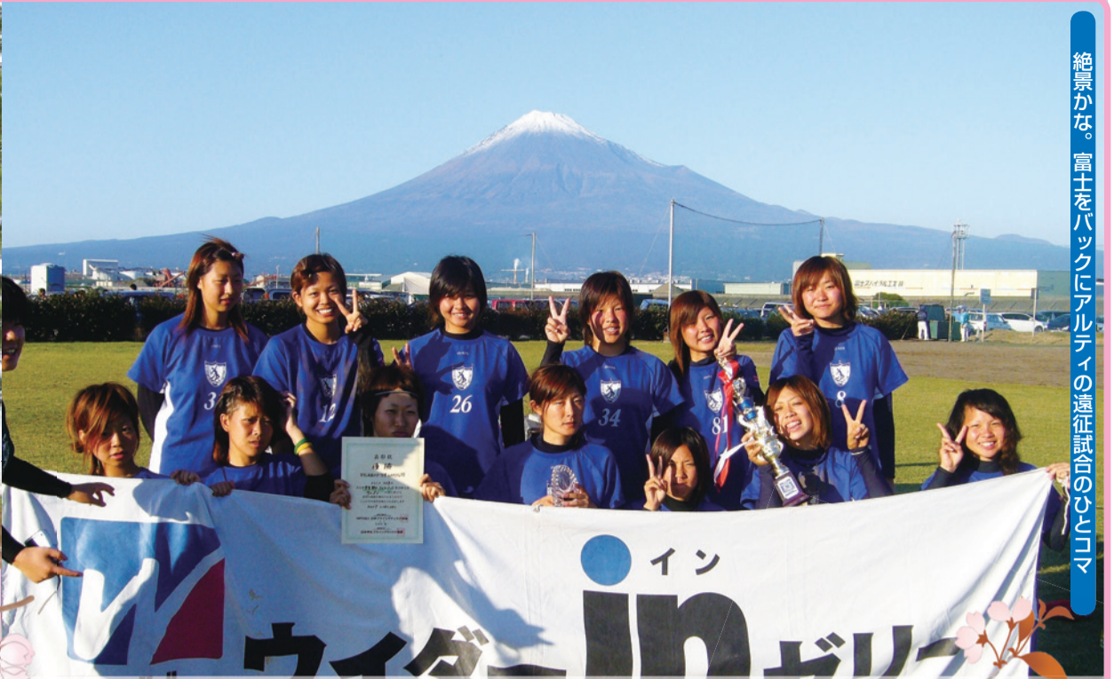
絶景かな。富士をバックにアルティの遠征試合のひとコマ