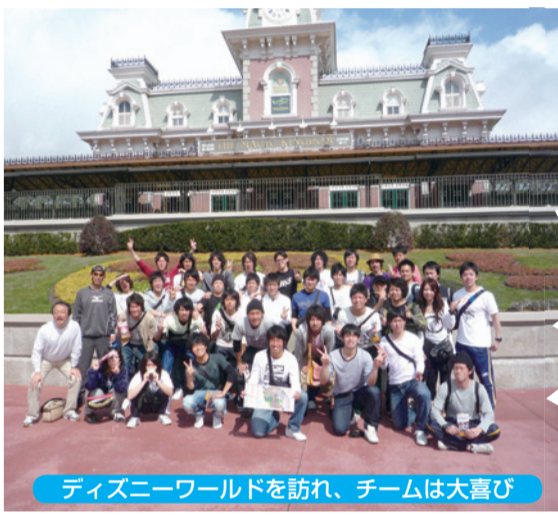
ディズニーワールドを訪れ、チームは大喜び

2月20日から28日までの間、サッカー部は米フロリダ州ブレイトン市にある「IMG Soccer Academy」を訪れ、春季キャンプを行った。豪州、スペイン、韓国に次ぐ海外合宿で米国は初の遠征になった。IMGアカデミーはサッカーの米国代表などエリートアスリートの育成機関として創設され、各年代の代表チームのほか海外のプロチームも強化合宿を行っている。今回の合宿では4人でびわスポが快勝したU-17米国代表チームとの親善試合など5試合を行い、4勝1分でプレシーズンのスタートを切った。 ピッチ外でも米国の生活を体験。オランダに移動してウォールト・ディズニール・ワールドに選手たちは 大満足。広大なテーマパークで一日を過ごした。タンパ市で行われた国際親善試合の米国代表対エル・サルバドルを観戦。1-1のスコアと攻防は一進一退で誰もがドロウで終わると思った矢先に米国がロスタイムに決勝ゴールをあげた。 約1週間の滞在だったが、選手にとって大学スポーツの本場、米国のスポーツ文化を垣間見ることができたのは大きな収穫だった。フロリダ中央大学では、スタジアムの施設のほか、プロチームのように組織化されたアシレティックデパートメントを目の当たりにすることができ、選手らが「天国と日本のスポーツ文化の違い」を見張っていた。