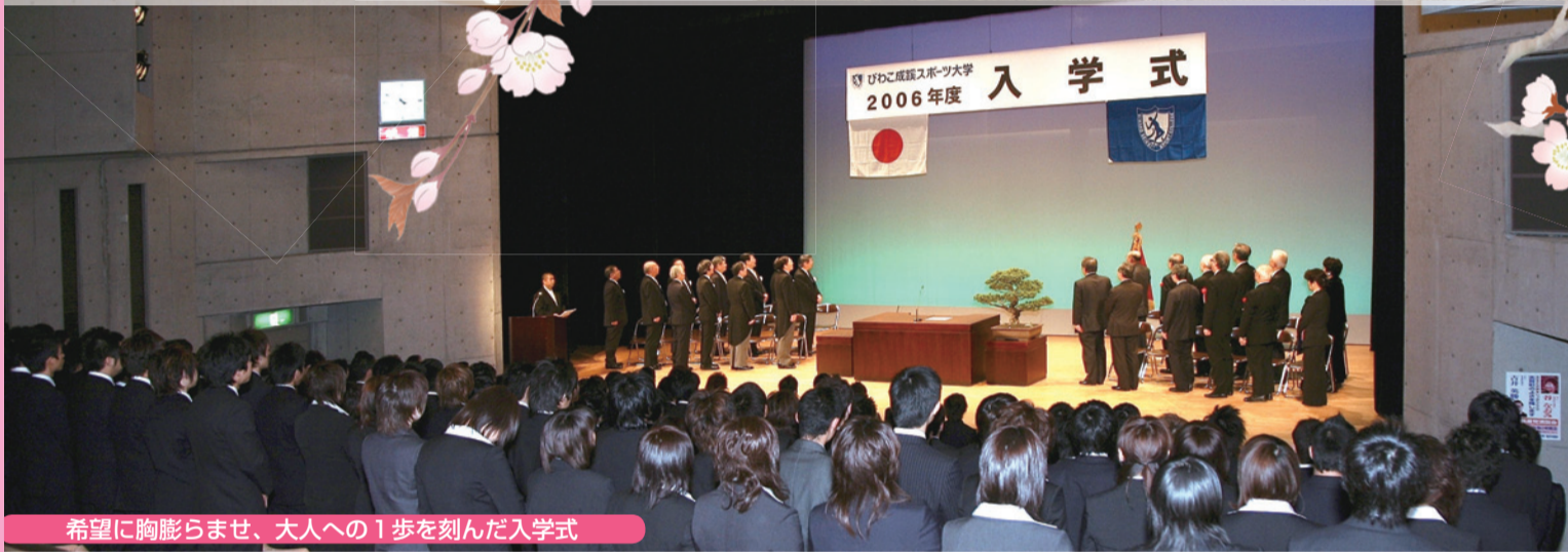
希望に胸膨らませ、大人への1歩を刻んだ入学式