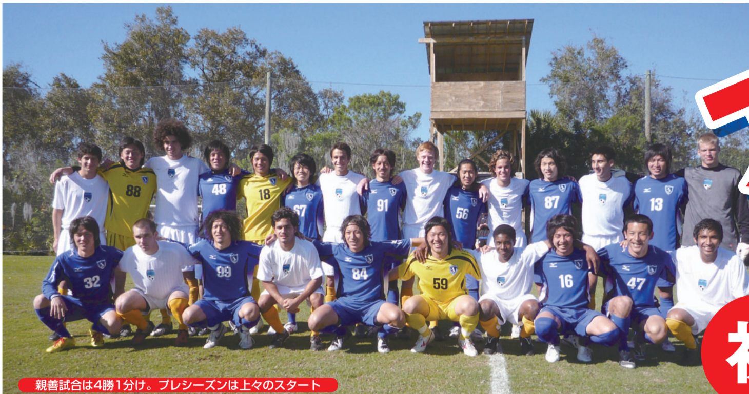
親善試合は4勝1分け。プレシーズンは上々のスタート