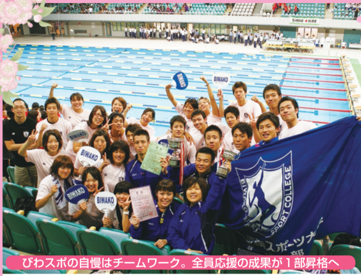
びわスポの自慢はチームワーク。全員応援の成果が1部昇格へ