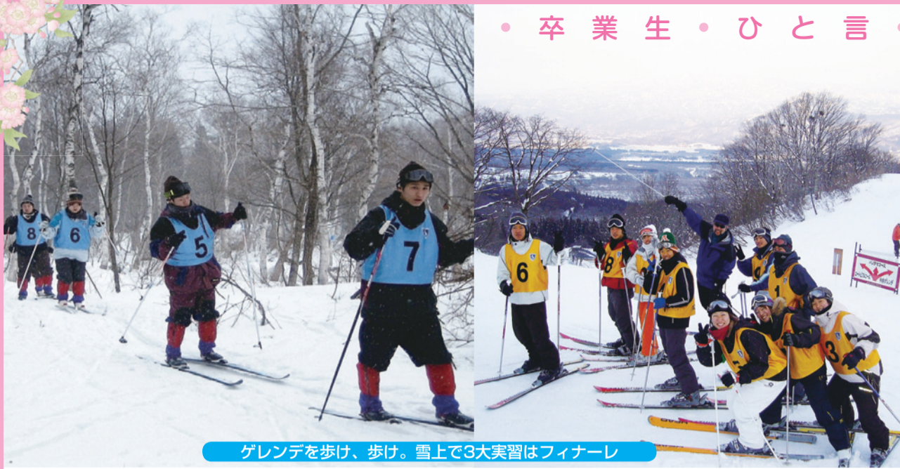
ゲレンデを歩け、歩け。雪上で3大実習はフィナーレ