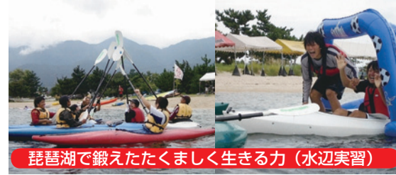
琵琶湖で鍛えたたくましく生きる力(水辺実習)