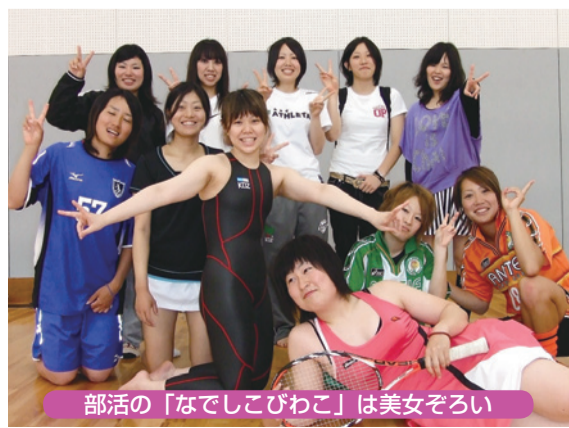
部活の「なでしこびわこ」は美女ぞろい