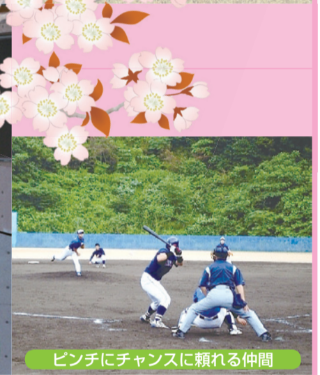
ピンチにチャンスに頼れる仲間