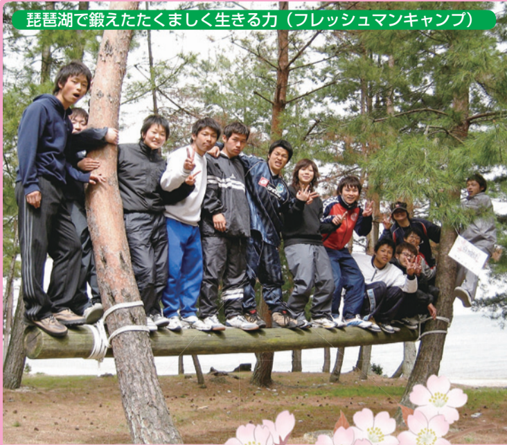
琵琶湖で鍛えたたくましく生きる力(フレッシュマンキャンプ)