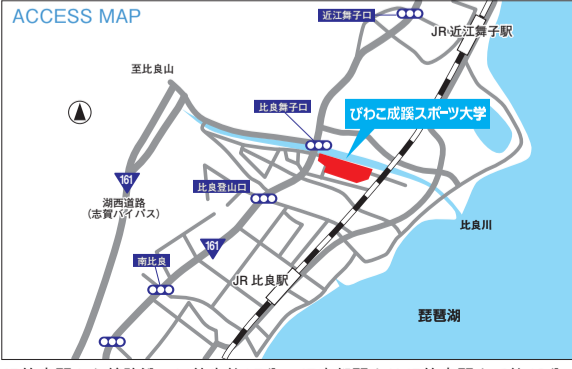
JR比良駅から線路沿いに徒歩約15分。JR京都駅よりJR比良駅まで約40分。

〒520-0503 大津市北比良1204番地 【代表】TEL:077-596-8410 FAX:077-596-8419 E-mail:jim@bss.ac.jp